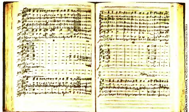
Νίκος Σκαλκώτας, «36 Ελληνικοί Χοροί», 1933-1935, χειρόγραφο

Μουσείο Μπενάκη - Πινακοθήκη Γκίκα (Κριεζώτου 3), από 25 Απριλίου έως 21 Ιουλίου