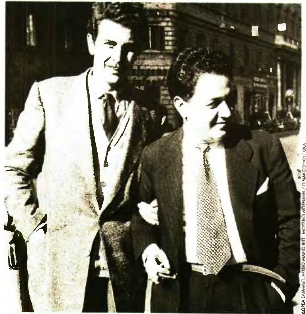
Ο Μάνος Χατζιδάκις και ο Μίκης Θεοδωράκης στην Νέα Υόρκη

με τη βοήθεια της τεχνολογίας τη δικτύωση που ένωνε τους μουσικούς αυτούς μεταξύ τους και με άλλους δημιουργούς αυτής της σημαντικής γενιάς, διερευνώντας εμμέσως τις πολλαπλές εκδοχές της ελληνικότητας. Τα ονόματα της έκθεσης που εξαπλώνεται στους τέσσερις ορόφους και στα 850 τ.μ. είναι βαριά όπως και η ιστορία αυτού του τόπου που φέρει τα ευγενή τους αποτυπώματα: Βαμβακάρης, Θεοδωράκης, Κωνσταντίνιδης (Γιαννίδης), Μητρόπουλος, Ξενάκης, Ξένος, Παπαϊωάννου, Σισιλιάνος, Σκαλκώτας, Τσιτσάνης, Χατζιδάκις. Εντεκα μύθοι δίνουν χώρο και υλικό να τους ανακαλύψουμε ξανά, μέσω της έκθεσης που ετοίμασαν με φροντίδα η μουσιολόγος Ερατώ Κουτσουδάκη, η αναπληρώτρια καθηγήτρια Μουσικής και Οπτικοακουστικού Πολιτισμού στο Ιόνιο Πανεπιστήμιο Ρεντά Δαλιανούδη, καθώς και οι επιστημονικοί συνεργάτες. Μικροί θησαυροί, σημειώσεις, φωτογραφίες, ηχητικά ντοκουμέντα δημιουργούν την ανάγκη να θυμηθούμε ότι υπάρχουν ακόμη τα ακριβά υλικά των δημιουργών που μπορούν να χαράξουν την πορεία μας. Αρκεί να τα ανακαλύψουμε ξανά.